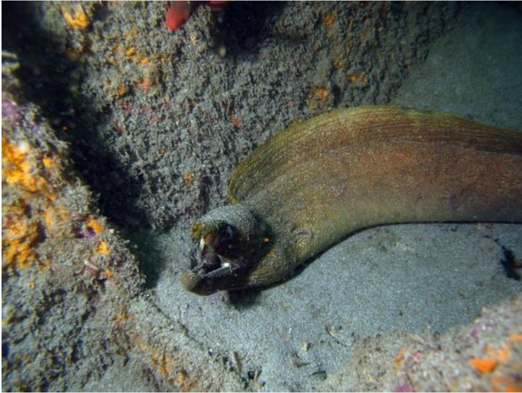
Murène se prenant pour un serpent