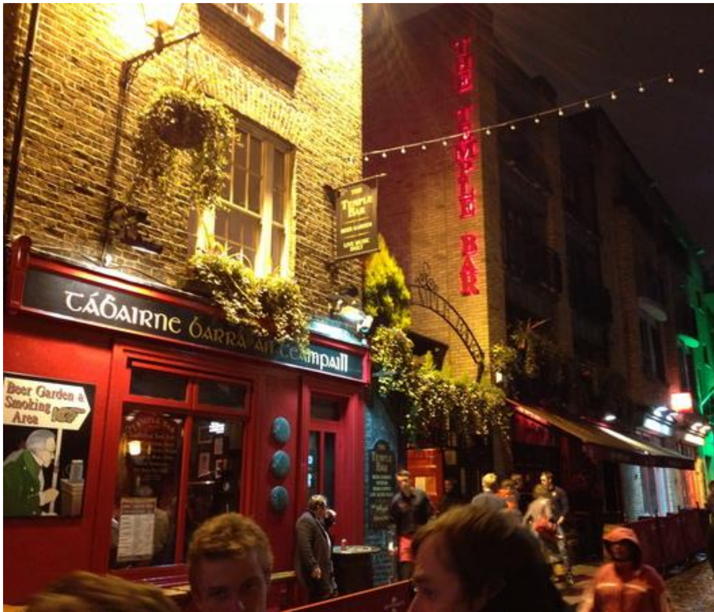
Visite de la ville