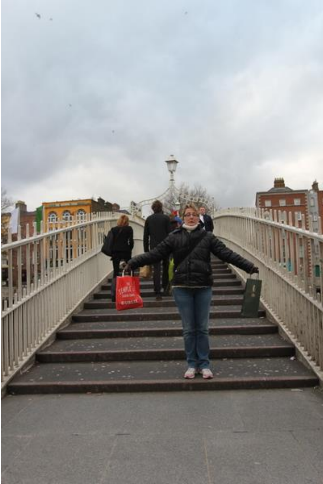
Soirée gastronomique à l'hôtel