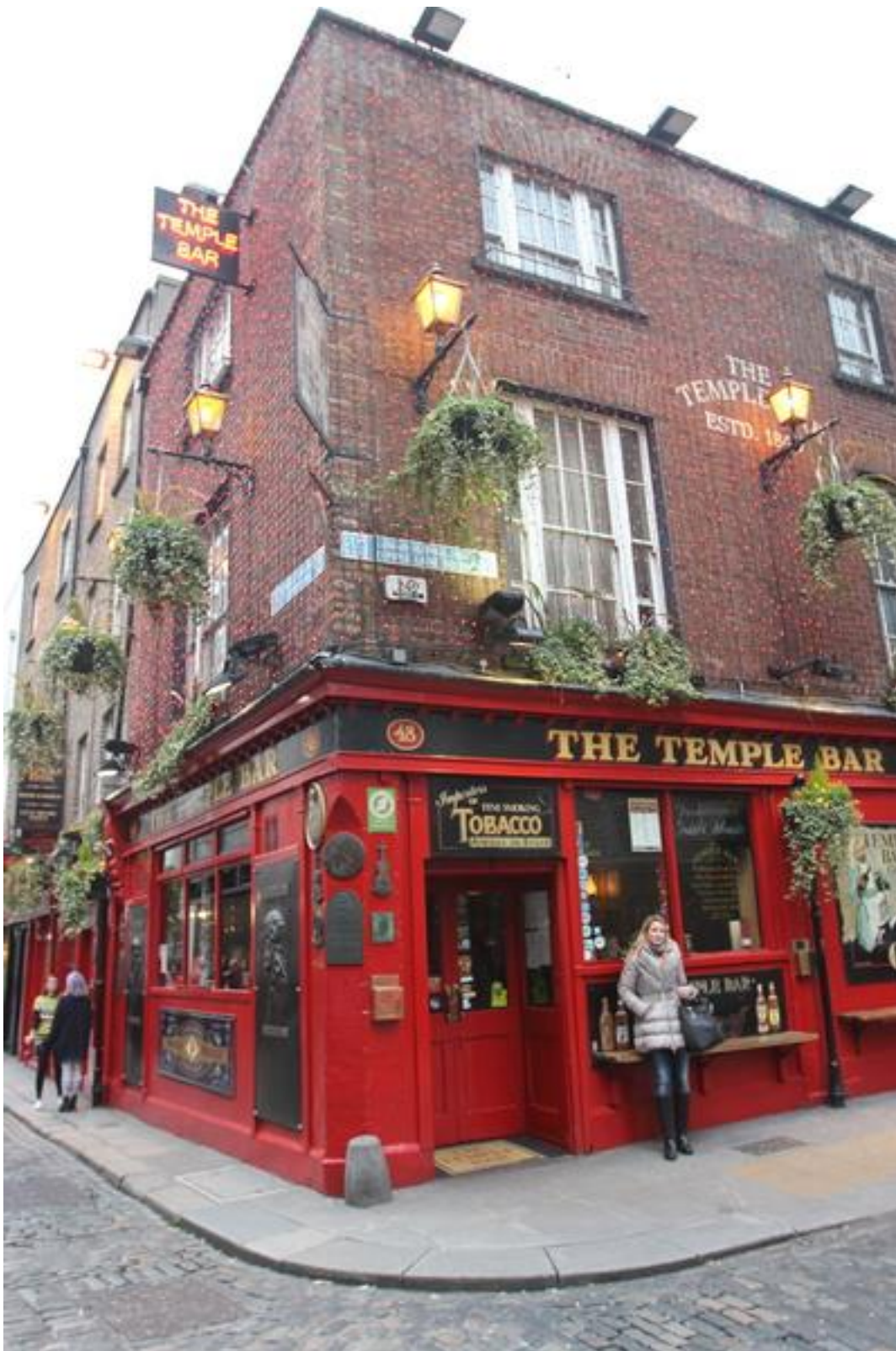
Le Half penny bridge