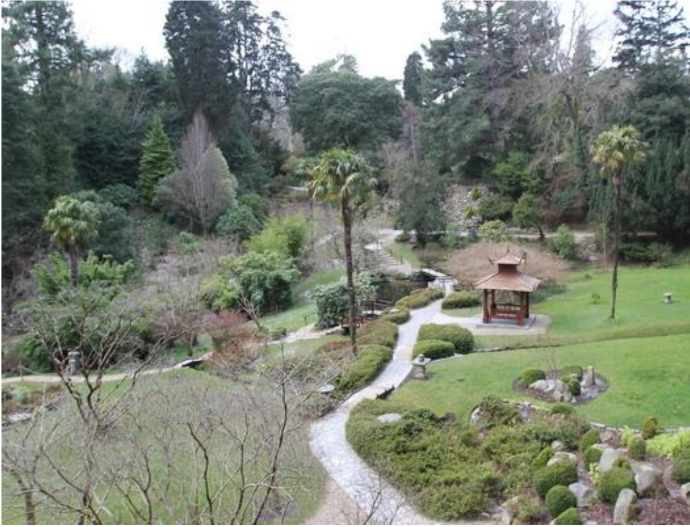
Ca caille !!