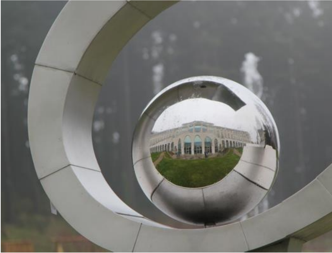
Notre « petite » chambre