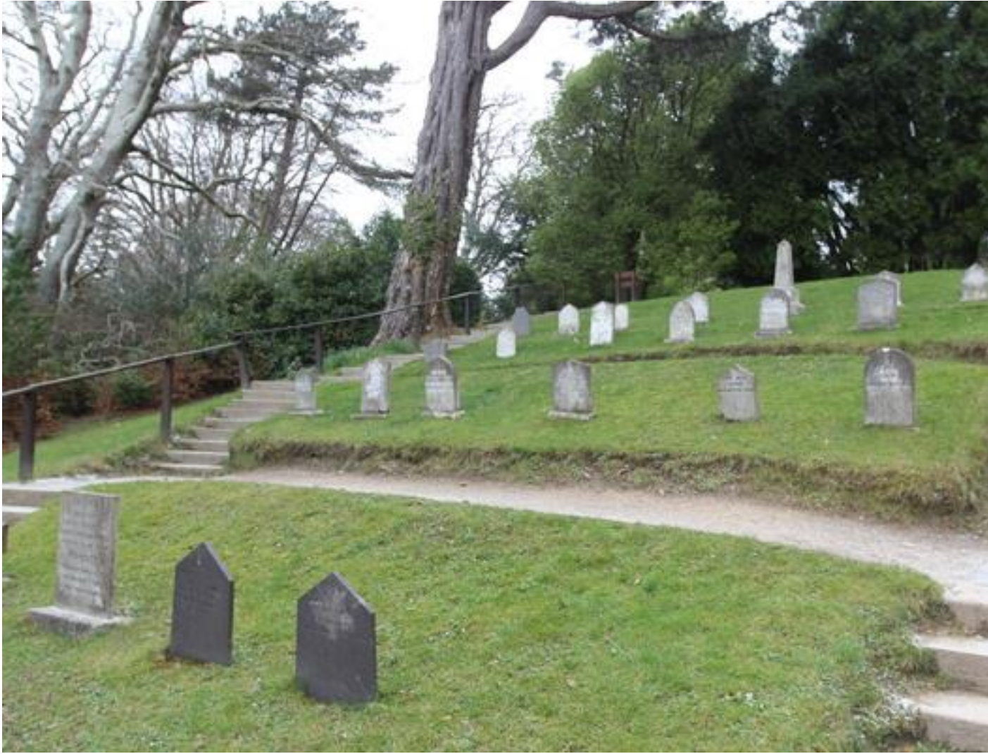
Ca caille (bis)