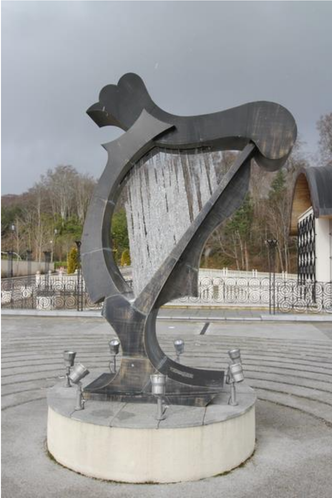
Dès notre retour, il re-neige