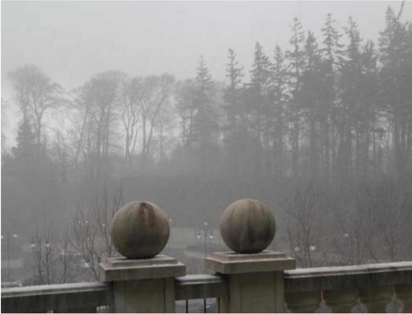
Sur le chemin du retour