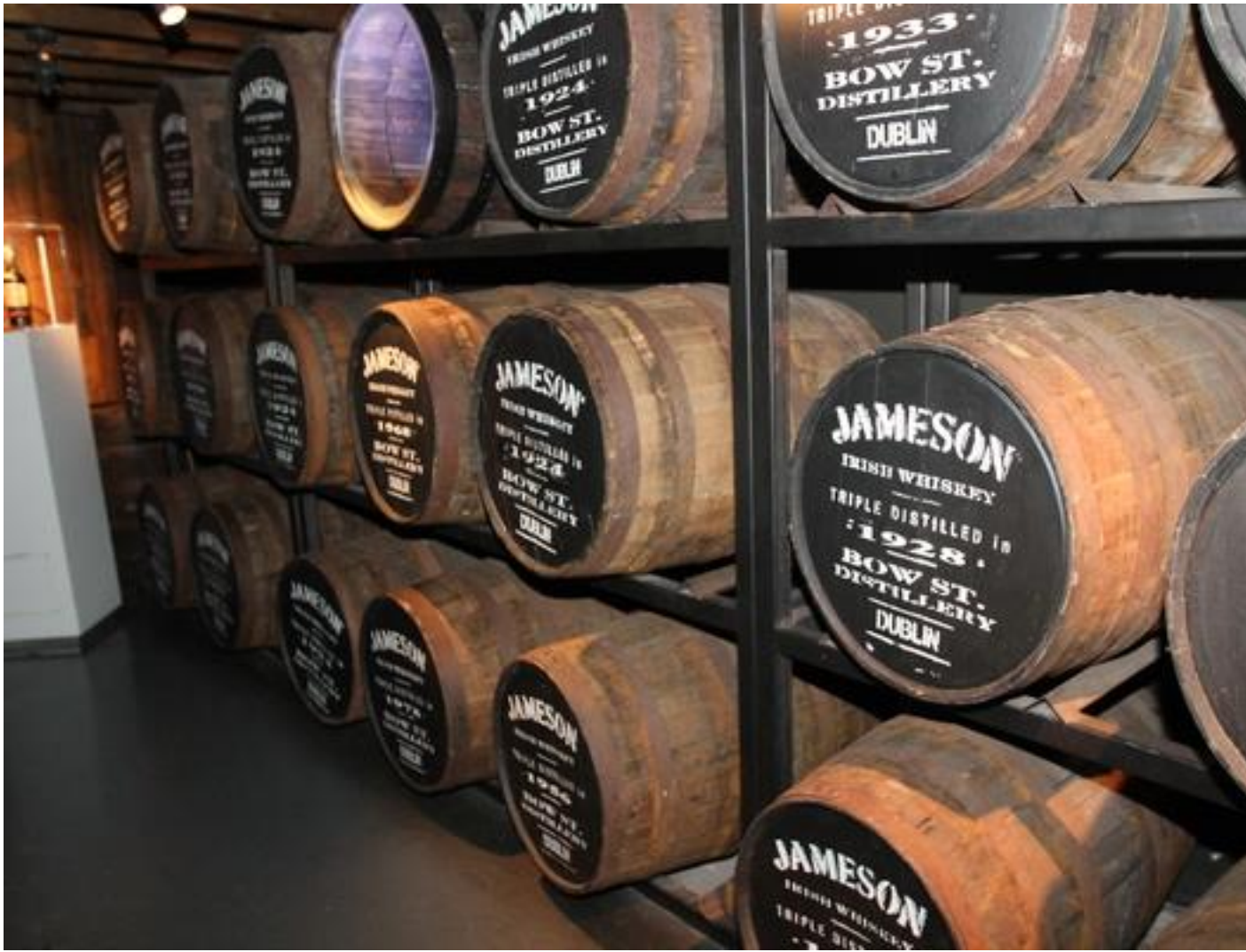
Dégustation de Whisky