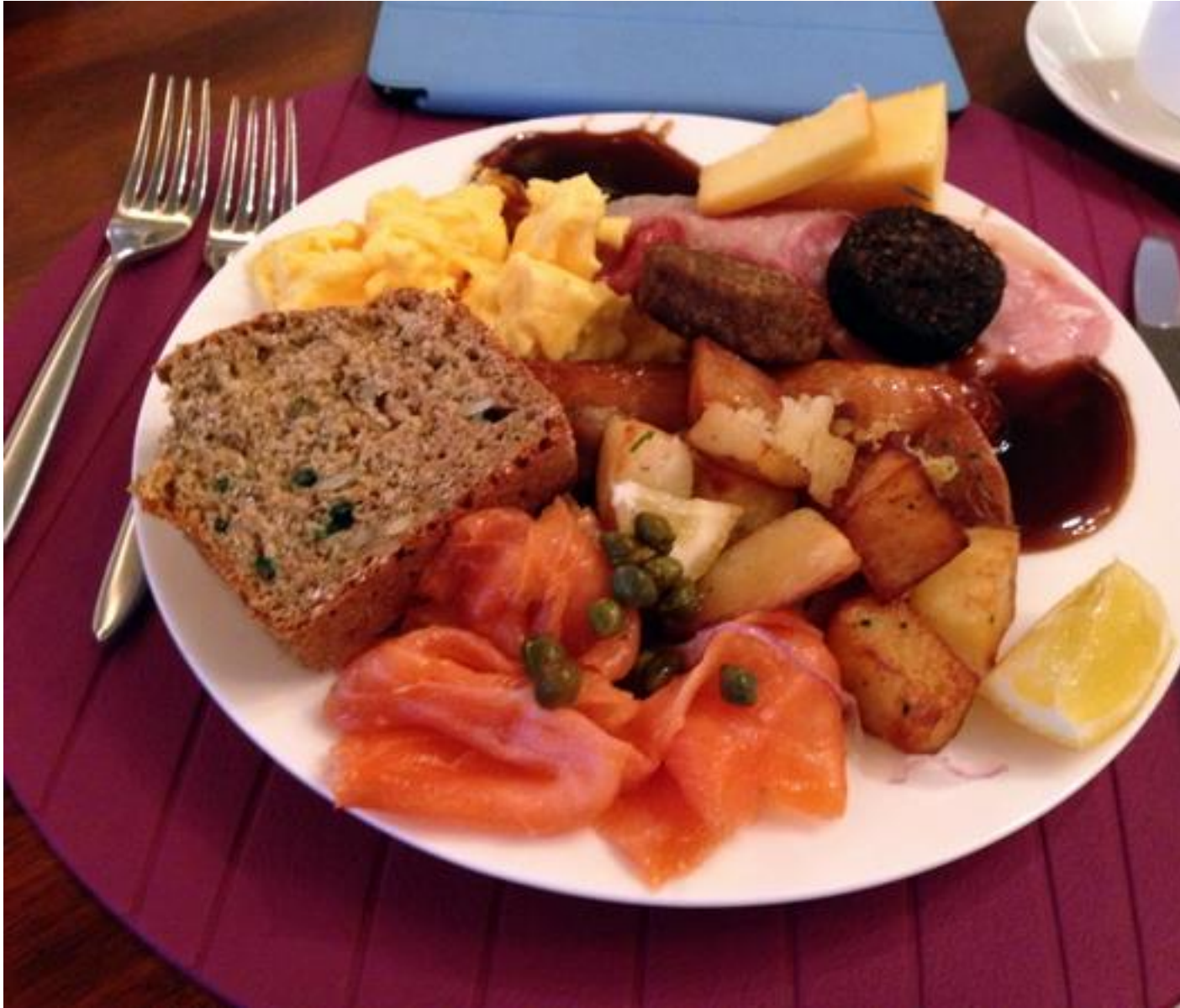
Le boutique du château (AVOCA) : http://www.powerscourt.ie/